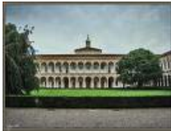
Università degli Studi di Milano