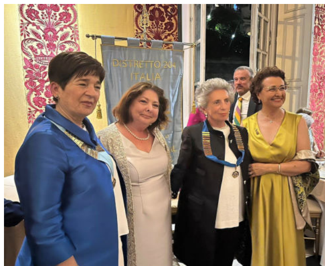
Milano S. Carlo Naviglio Grande