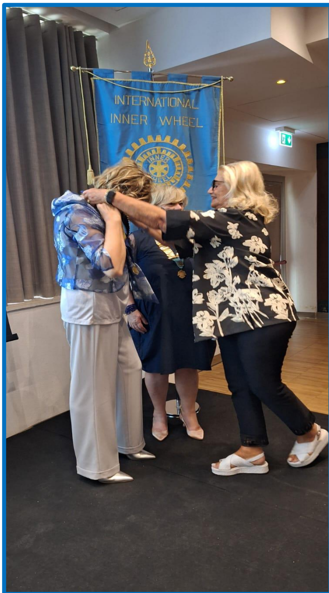
Il rinnovato passaggio del collare

Si è svolta domenica 9 giugno la seconda Assemblea Distrettuale a Creazzo – Vicenza. Nel momento dedicato al nostro club è stato formalizzato il passaggio del collare tra la presidente uscente e l'incoming presidente alla presenza della governatrice Isabella Lombardo Marani, la quale ha ricordato la sua visita al nostro club mostrando sullo schermo una foto scattata in quell'occasione.