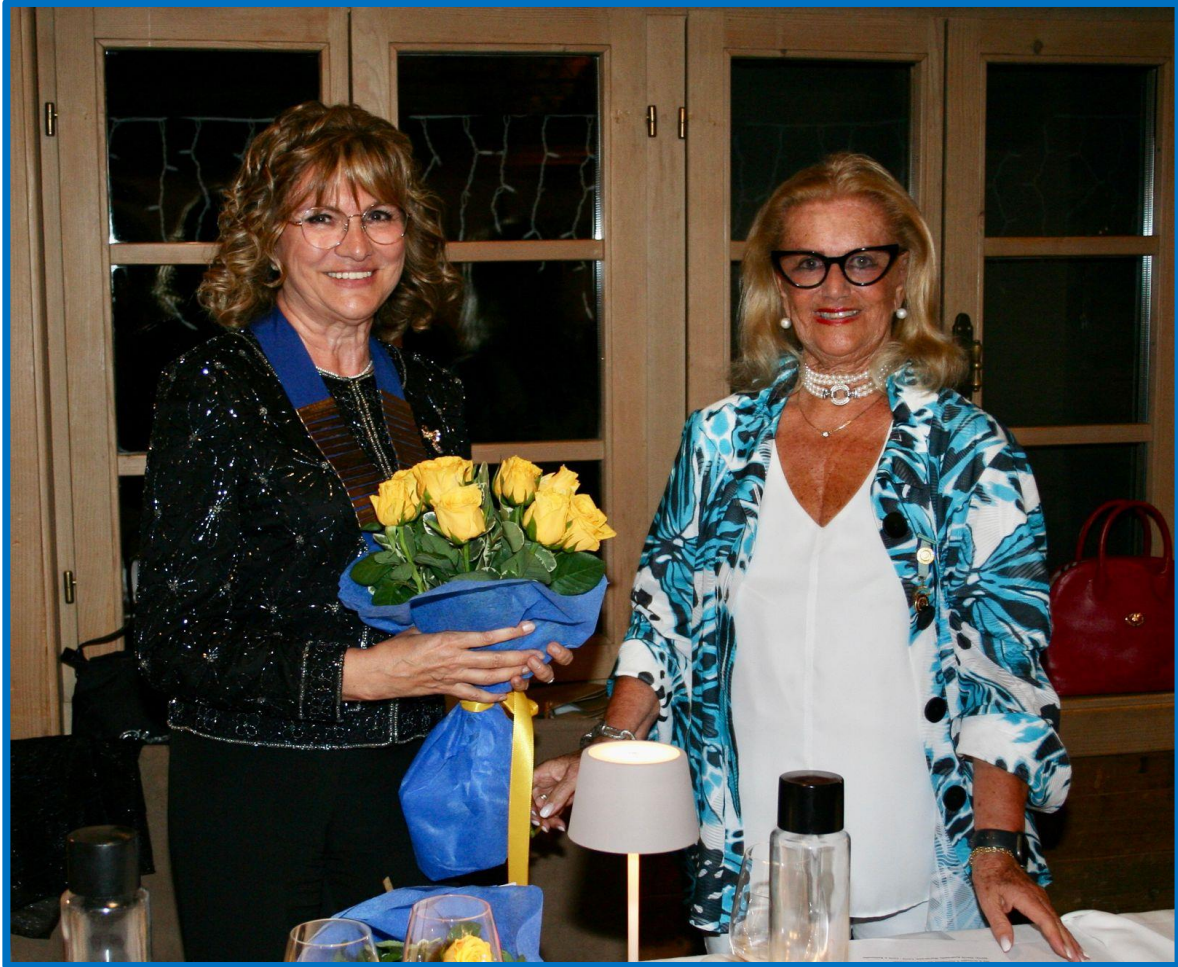
Le due presidenti

Entrambe hanno spiegato il filo conduttore dell'attività svolta nell'annata trascorsa e quello del programma a venire, ciascuna motivandone scelte e ispirazione.