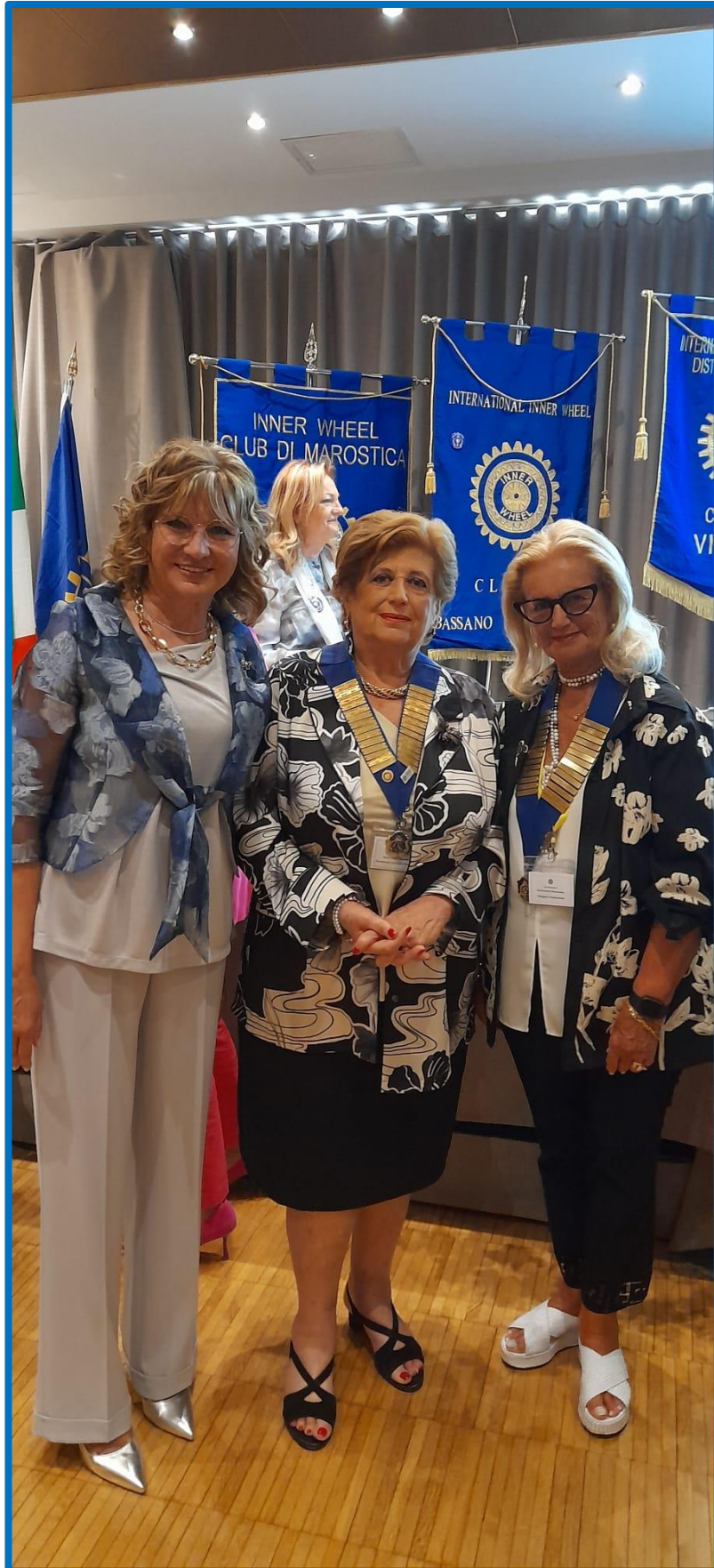
Con la Presidente Nazionale