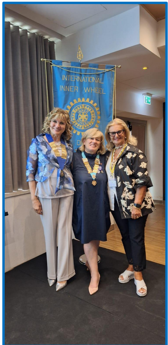
Le presidenti con la governatrice