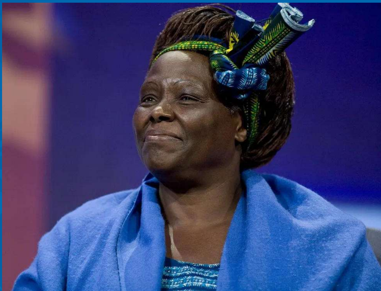
WANGARI MUTA MAATHAI PREMIO NOBEL PER LA PACE 2004

Bollettino N°2 Anno Inner Wheel 2023-2024